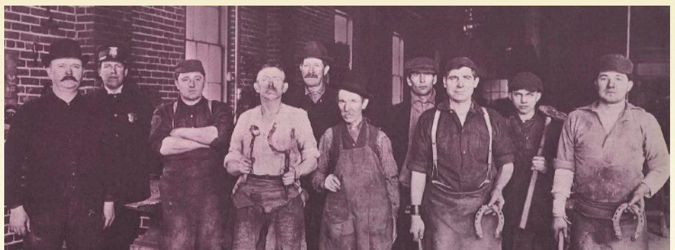
創業者オーガスト・フルハーフと仲間たち

開館時間 10:00~17:00(入館は16:30まで) 休館日 毎週月曜日(4月29日・5月6日は開館)、4月23日、5月7日 入館料 高校生以上200円 / 65歳以上100円 / 中学生以下無料 *団体20名以上半額 交通 JR・京浜急行品川駅高輪口徒歩7分 / 都営浅草線高輪台駅A1出口徒歩7分