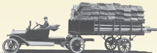
最初期のフルハーフ・トレーラー