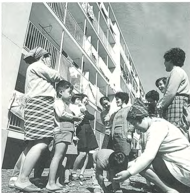
社宅の井戸端会議 神奈川県横浜市 昭和46年(1971)