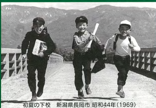
初夏の下校 新潟県長岡市 昭和44年(1969)