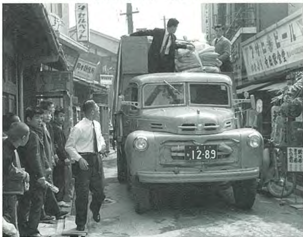
お嫁入り道具を運ぶ 大阪府枚方市 昭和37年頃(1962頃)