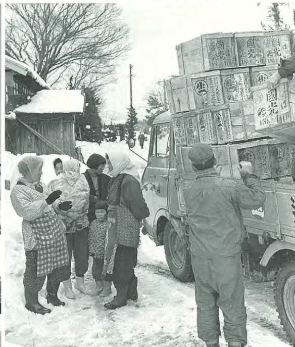
リンゴ木箱を運ぶ 青森県板柳町 昭和37年(1962)