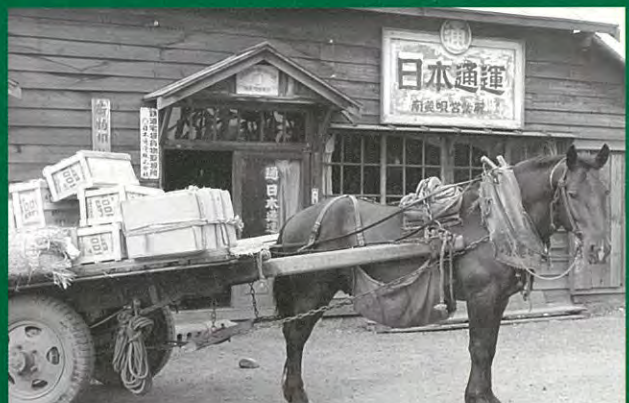
目通営業所前の荷馬車 北海道美瑛市 昭和30年代半ば頃