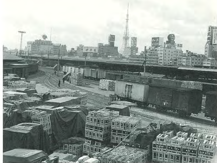
酒列車「灘号」到着の汐留駅 昭和41年(1966)