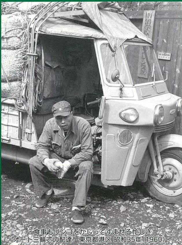
食事もリンゴをかじってすませる忙しさ オート三輪での配達 東京都港区 昭和35年(1960)