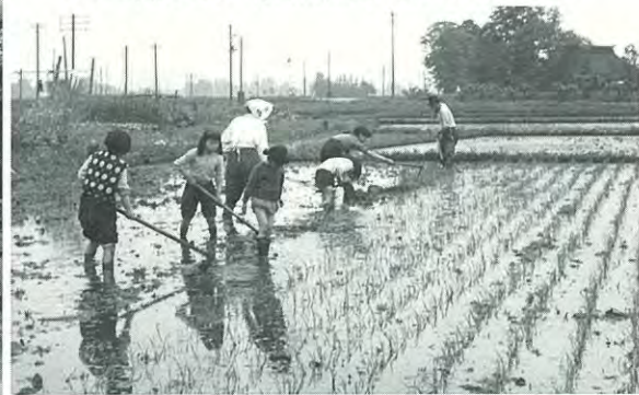
田植えのお手伝い 岩手県水沢市 昭和41年(1966)

物流博物館には、日本通運(株)が戦後を通じて、広報誌や社内報「日通だより」の取材・編集、あるいは業務記録などのために撮影・収集し続けてきた多数の写真が収蔵されています。今回の展示では、これらの中から昭和30年代～40年代に撮影された写真にスポットをあて、高度経済成長期を中心とした日本の風景を振り返ります。この時代には「運ぶ」現場はもちろんのこと、家族の姿、農村や街の様子、暮らしの風景などの写真が数多くカメラに収められています。当時は、企業と従業員およびその家庭との距離が近い時代でもありました。残された写真を通して、企業の目に映った昭和の風景を考えます。