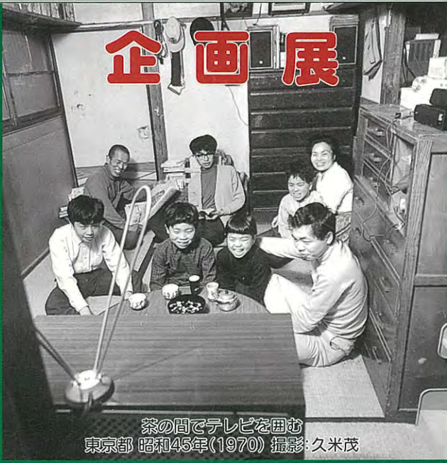
茶の間でテレビを囲む 東京都 昭和45年(1970)