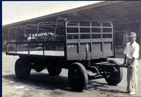
写真上・左から順に 金剛製作所のパンフレット 1940年頃 ※1 南満洲鉄道による道路列車の実験 1939年入手 ※2 荷馬車に改造された自動三輪車 1944年 ※2 廃車トラックを利用した戦時型トレーラー 1944年 トレーラーを支える人物は早くからトレーラーの研究・導入に尽力した平原直氏 シーランド社の海上コンテナとセミ・トレーラー 1967年 日本通運㈱の500トントレーラー 1971年 名神高速を行くフル・トレーラー 1969年 ※1 流通経済大学 物流科学研究所 平原直物流資料室蔵 ※2 青木裕子氏蔵 / 特記のない写真はすべて物流博物館蔵