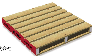
一貫パレチゼーション用 木製平パレットT11型 1,100mm×1,100mm