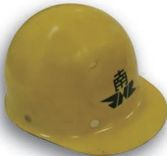
汐留駅で使われていたヘルメット 鉄道博物館蔵