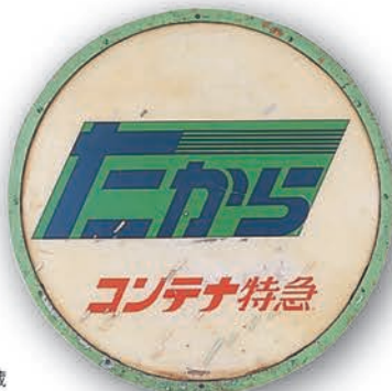
「たから」号テールマーク 鉄道博物館蔵