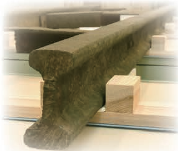
汐留駅の側線に使用されていた双頭レール 物流博物館蔵