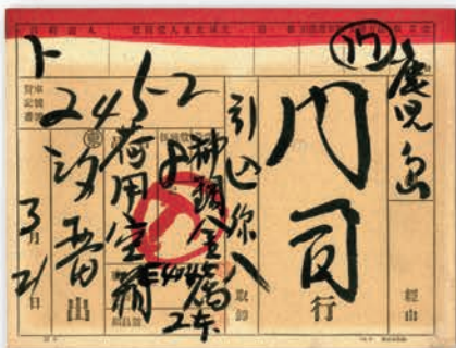
汐留駅発送貨物の普通車票(軽量品表示) 1950年頃 NPO法人貨物鉄道博物館蔵