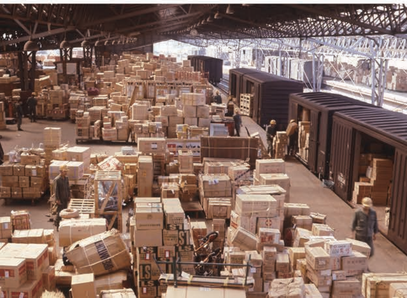
汐留駅混雑發送ホーム 1970年 物流博物館蔵