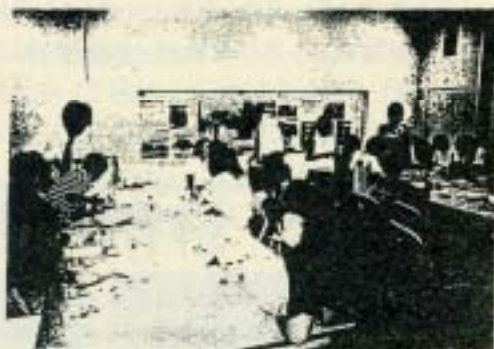
「段ボール工作教室」にて、宅配便の集配車を作成中

配車には色をつけてオリジナルの車に仕上げましたが、宅配便の会社もびっくり！なデザインが続々と登場していました。