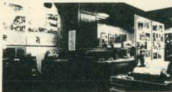
「物流の歴史」展示室

製作していただいたのは、昔ながらの二重俵と改良型の複式俵の2種類です。米俵のしくみはどうなってるの？という疑問に答えるために、お米を詰める前の俵も展示しています。2分の1のミニチュアサイズもあります。実際の米俵は65kgくらいあったそうですが、この米俵は10kgにしていますので、ちょっと腕に自身のある方は学芸員に担ぎ方を教えてもらって実際にかついでみてはいかがでしょう？また、自由に触ることもできますので、わらのとげとげした感触なども味わって昔の人の苦勞をしのんでみては？