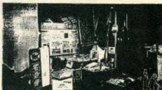
「現代の物流」展示室の身近な物流・宅配便のコーナー

ています。最近、インターネットが発達して、買物などもインターネットでできますが、品物を届けるのは宅配便の仕事です。インターネットが普及してますます便利な世の中になっても、モノを運ぶという仕事はなくなるらない、むしろますます重要な仕事になっていくことでしょう。