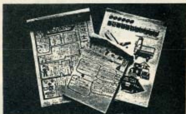
児童のみなさんが作った新聞の一部

これらの学校では、こうした学習の成果を児童のみなさんが下の写真のようなすばらしい新聞にまとめて館に送ってくださるなど、見学を通じたやりとりを行うことができました。