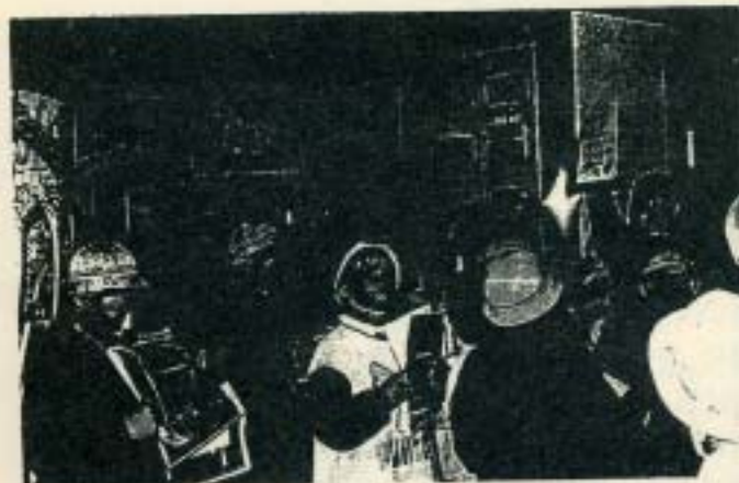
見学のようす(「現代の物流」展示室にて)

見学の形態もさまざまで、遠方の小学校からは社会科見学として来館していただく場合が多かったのですが、港区や近隣の区からは授業の一環としてクラス単位で見学に来ていただくケースがほとんどでした。昨年度は、1クラス24名の学校