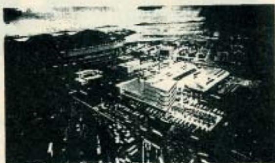
人気の「陸海空の物流ターミナル」大型ジオラマ模型 陸海空のターミナルを鳥の視点で見ることが出来ます。 物流は24時間動いているということで、模型も夜になり朝がやってきます。夜景はなかなかキレイ。

館内の展示の中でよかったものは？との質問でもっとも高い得点を得た展示は、「現代の物流」展示室にある陸海空のターミナルを表現した大型ジオラマ模型でした。これは空港・港・トラックターミナル・鉄道貨物ターミナルを150分の1の模型にしたものです。2位は同展示室の「みちかな物流・宅配便」のコーナー、3位と4位にも同じ展示室の映像ブースと物流ゲームが同点で入りました。